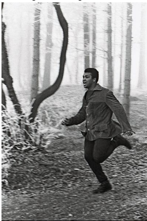
«The Greatest» im Training auf dem Uetliberg. Muhammad Ali läuft 1971 vor seinem Kampf im Hallenstadion im Wald.