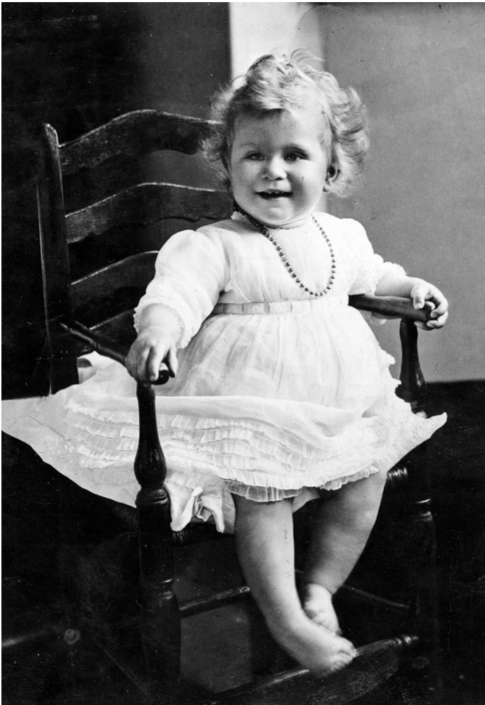
Queen Elizabeth II